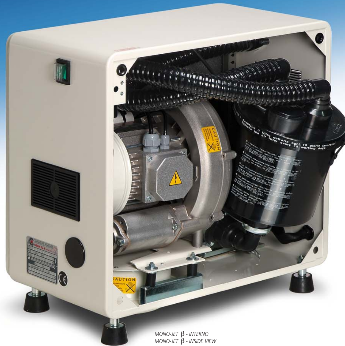
MONO-JET \beta - INTERNO MONO-JET \beta - INSIDE VIEW