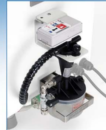
MONO-JET \gamma - DETTAGLIO IDROCICLONE MONO-JET \gamma - HYDROCYCLONE (PARTICULAR)